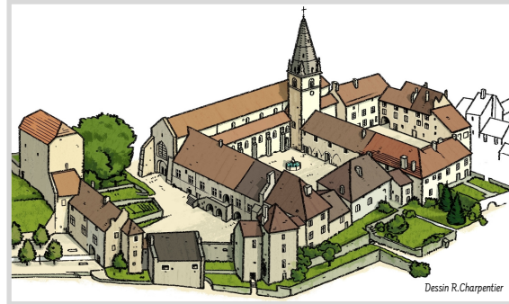
Dessin R. Charpentier

À la Révolution, l'église abbatiale devient église paroissiale. Les bâtiments, vendus comme biens nationaux, sont aujourd'hui propriétés de la commune ou de particuliers.